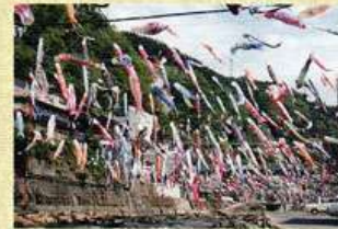
杖立温泉鯉のぼり祭り(4月)