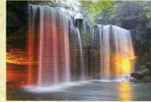
鍋ヶ滝ライトアップ(5月)