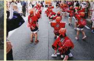
ふるさとの秋まつり(10月)