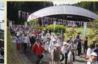
小国ツーデーウォーキング(4月)